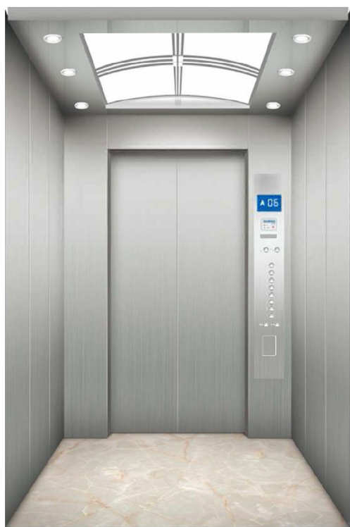
MODELO Home lift, MR